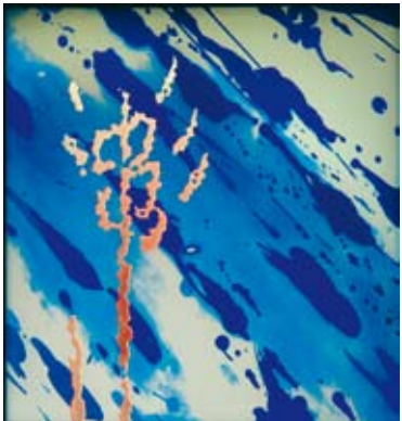
Ähre – „den Hungrigen zu essen geben“