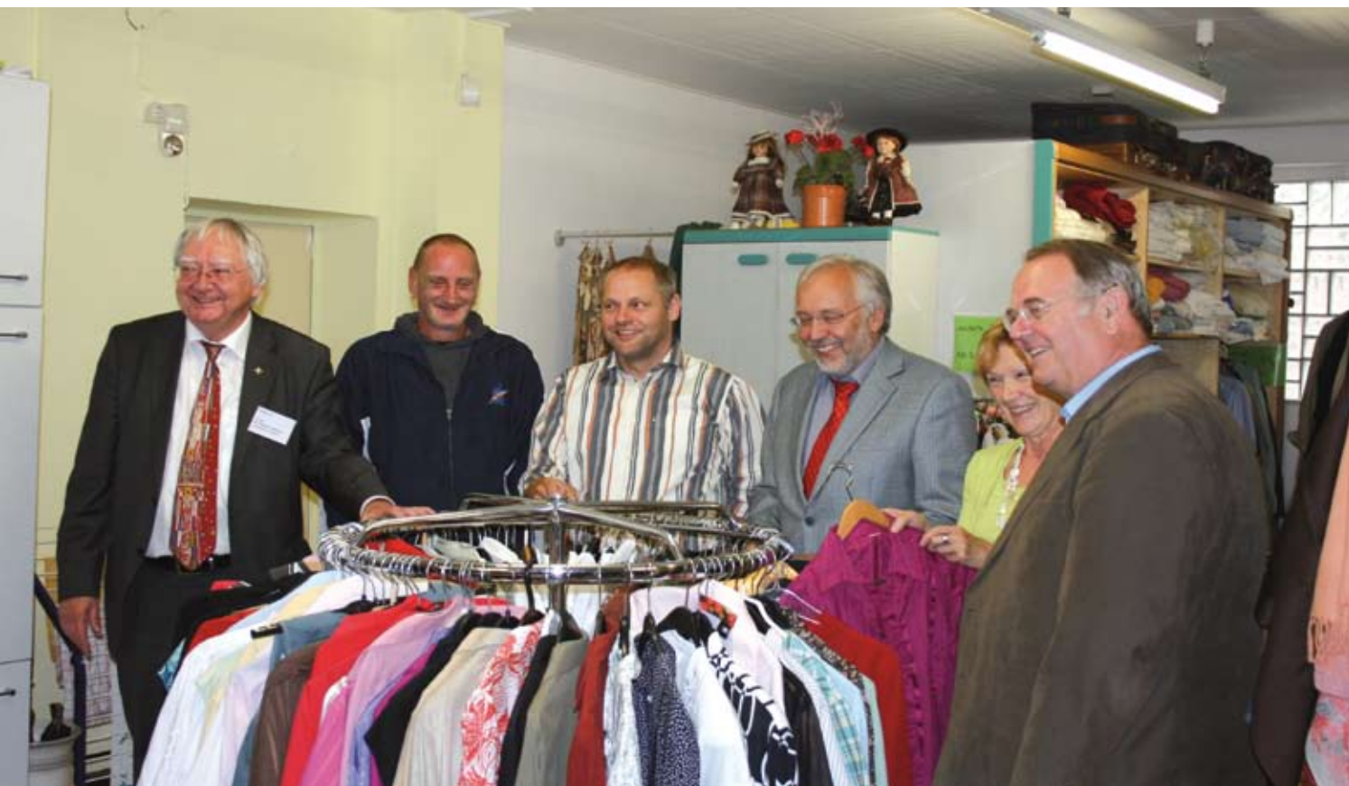
Der Landespfarrer besucht den EinLaden in Homberg