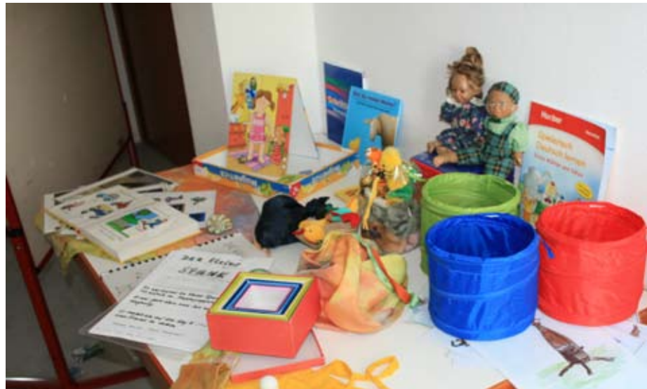
Materialien für Kinder. Fachtagung am 1. Juli 2010.

Während in der Vergangenheit Trägerengagement durch Vorleistung zu Gunsten der Qualität immer gewürdigt und honoriert wurde, fühlten sich diese Träger erstmals durch das Hessische Sozialministerium „abgewatscht“ und bestraft –