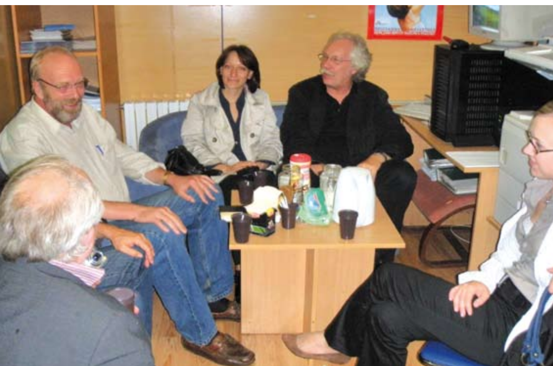
„Way home“ in Odessa Fachgespräch mit der Leitung über Straßenkinder

In Odessa haben wir uns mit der Situation der Straßenkinder befasst und dazu Kontakt mit der Sozialbehörde, der Universität und Hilfsorganisation gehabt. Wir erfuhren, dass aus den Großheimen immer mehr Kinder und Jugendliche fortlaufen und lieber auf und un-