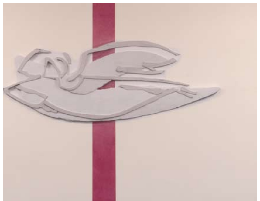
Engel in der Kapelle des Diakonischen Werkes, von Tobias Kammerer