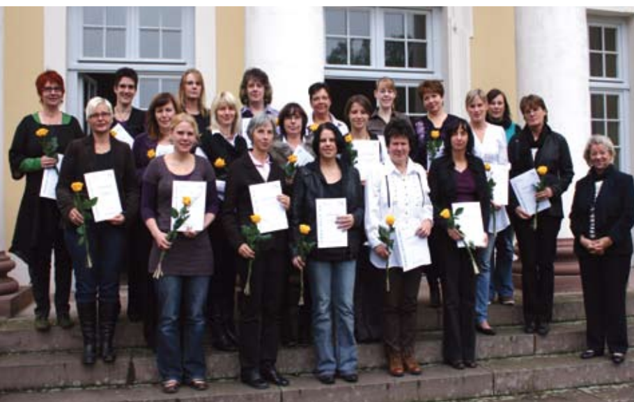
Geschafft. Teilnehmerinnen der U3-Fortbildung nach der Zertifikatsübergabe am 1. Oktober 2010 in Hofgeismar.