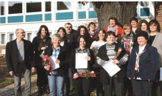
Die neuen Pflegeberater/-innen nach der Übergabe der Zertifikate am 28. Januar 2011

Pflegeberatung entwickelt sich als Kernleistung der Pflege weiter und zu einem potenziellen Geschäftsfeldzweig der ambulanten Pflege, hier existiert Handlungsbedarf in Leistungsrechtlicher Hinsicht. Mit dem o.g. Qualifizierungsprogramm