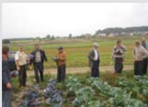
Landwirtschaftliche Beratung in Russland