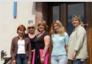
AIDS-Prävention in Estland