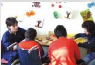
Unterstützung von Pflegeelternfamilien in Bulgarien