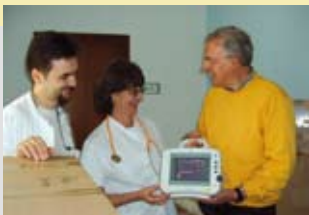
Unterstützung für leukämie- kranke Kinder in Rumänien