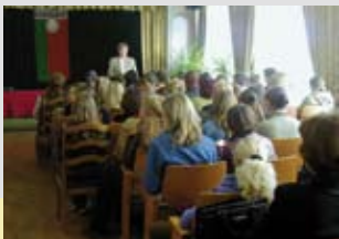
Beratung gegen Frauenhandel in Weißrussland